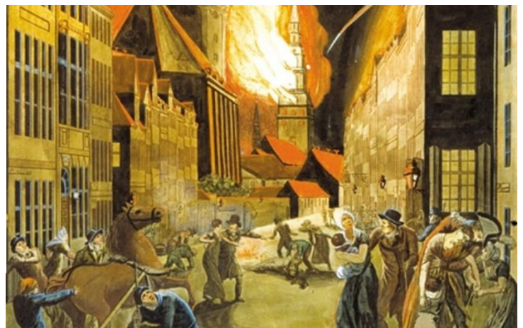
Udsnit af billede fra Københavns bombardement i 1807