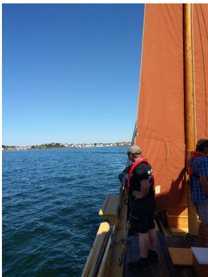
Billede fra den første sejltur med Corsør. Vi er på vej ind i havnen i Korsør