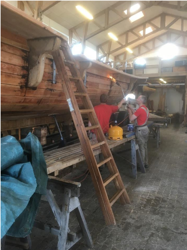
Efter kalfatring bliver der tjæret

I løbet af de tre år har Slagelse kommune velvilligt bistået på flere måder, ikke mindst med økonomiske midler. Der har desuden i flere sammenhænge været støtte fra LAG-midler og EUs regionalfond (via ineterreg), så udenlandske elever har kunnet deltage i arbejdet. Flådestation Korsør har i flere omgang hjulpet med det praktiske og desuden stillet den stor 2 tons kanon til rådighed, og mange andre lokale kræfter har givet en hånd med både her og der.