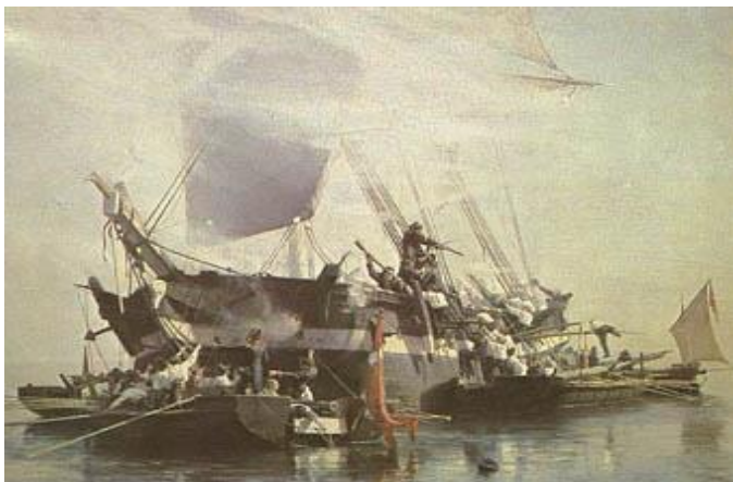
Engelsk brig erobres af kanonbåde

Historien bliver gengivet noget længere og med mange flere detaljer i et væld af bøger om emnet. Der er mange gode historier, man kan gå på opdagelse i.