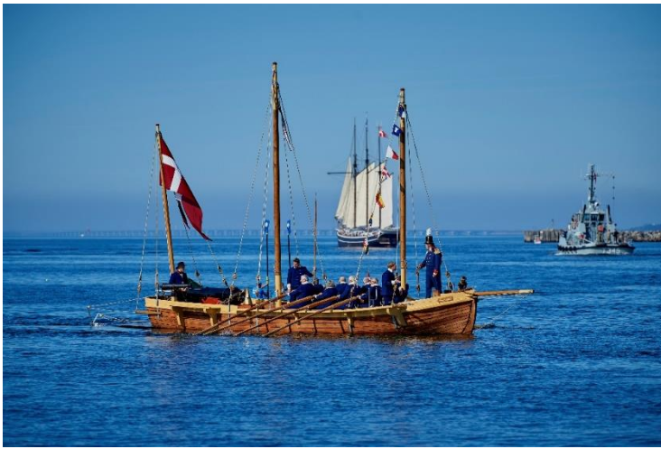
Mandskab i paradeuniformer ror Corsør efter søsætningen