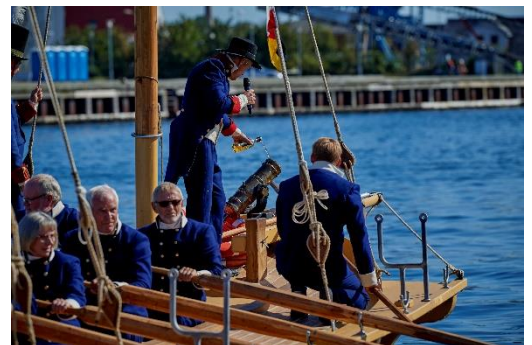
Også haubitseren velsignes med brændevin

I et forsøg på en hurtig genopbygning af flåden blev der i løbet af få år fremstillet mange kanonbåde. De var slet ikke så store som de stjålne krigsskibe, men til gengæld kunne de ros og derfor også manøvrere når der ikke var nogen vind. Det kunne de store engelske krigsskibe ikke, og det lykkedes derfor faktisk flere gange for en lille flok kanonbåde at nedkæmpe et større engelsk krigsskib.