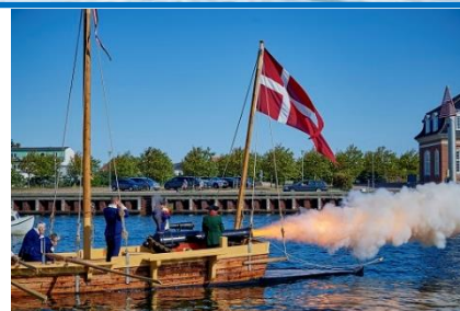
Første salut fra Corsør ved søsætningen i august 2019.

Corsør skal nu deltage med både sejlads og salut i begivenheder i Korsør havn og andre steder. Og det muligt for gæster, skoleklasser, foreninger og firmaer at komme og bese kanonjollen, måske prøve at sejle ud med den, måske endda ud til salut ude på vandet. Der er i det hele taget mange oplevelser for syn og hørelse og armmuskler i Corsør.