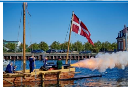
Første salut fra Corsør ved søsætningen i august 2019.

Corsør skal nu deltage med både sejlads og salut i begivenheder i Korsør havn og andre steder. Og det muligt for gæster, skoleklasser, foreninger og firmaer at komme og bese kanonjollen, måske prøve at sejle ud med den, måske endda ud til salut ude på vandet. Der er i det hele taget mange oplevelser for syn og hørelse og armmuskler i Corsør.