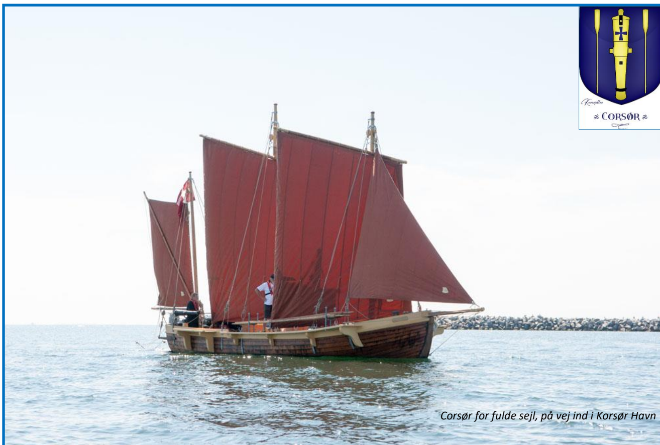
Corsør for fulde sejl, på vej ind i Korsør Havn